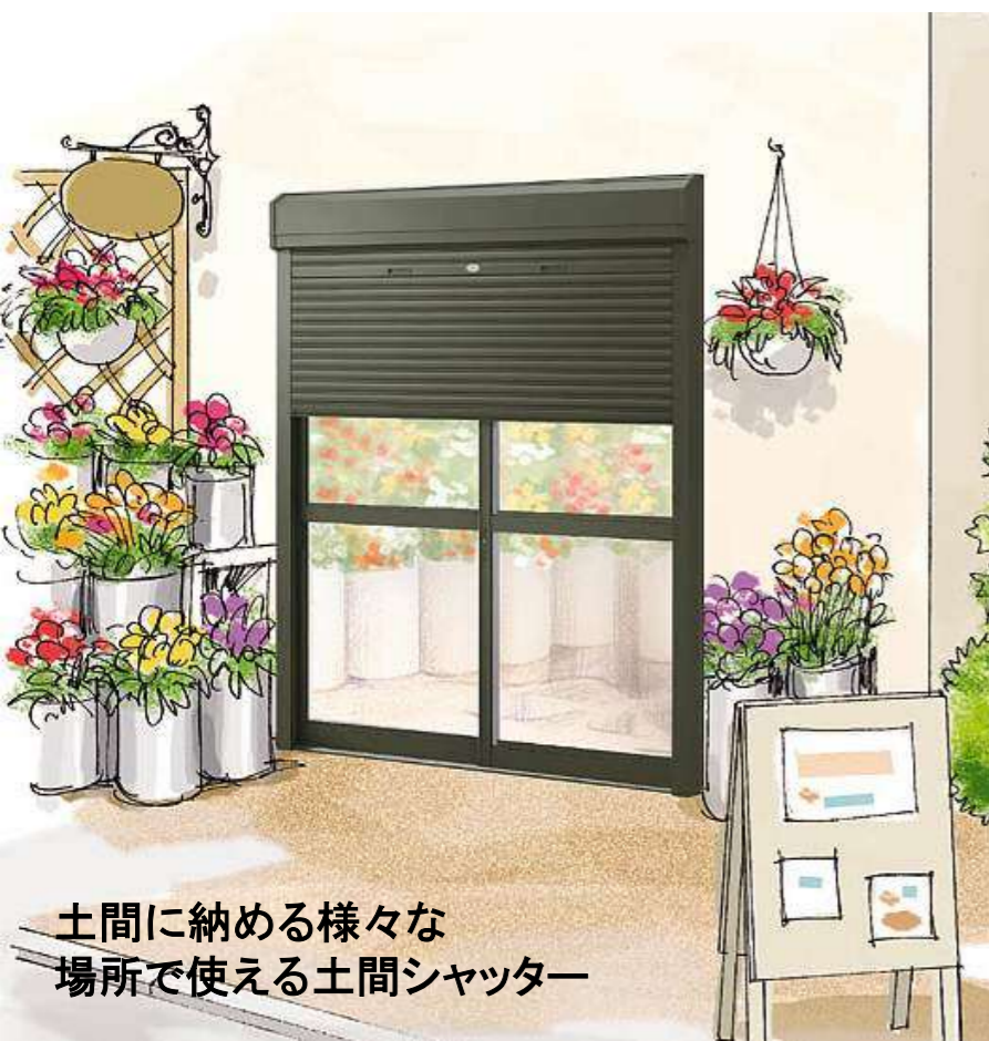
土間に納める様々な 場所で使える土間シャッター