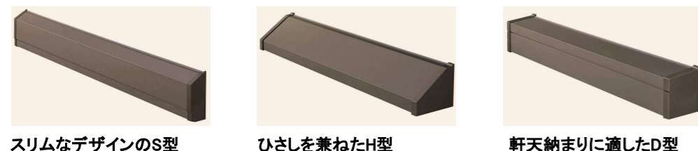
スリムなデザインのS型 ひさしを兼ねたH型 軒天納まりに適したD型