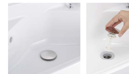
ヘアキャッチャー

髪の毛がヘアキャッチャーにからみにくくお手入れもカンタン。凹凸が少ないので、ブラシでラクにお掃除できます。